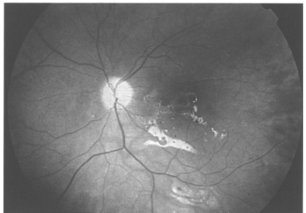
Abb. 2. CMV-Retinitis mit Amotio retinae nach Silikoninjektion

Bei allen Patienten konnte durch Silikoninstillation eine 100%ige Wiederanlegung der Netzhaut erreicht werden. Teils aufgrund optischer Phänomene des Silikons bei Aphakie oder